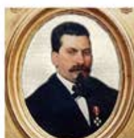
Concezio Rosa (Castelli 1824 - Corropoli 1876)